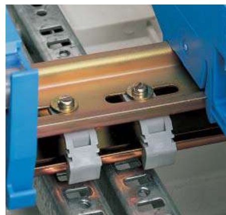
Изолированное крепление несущего рельса в распределительной коробке для обеспечения 2 класса защиты. Показано с клеммами типа topjob.