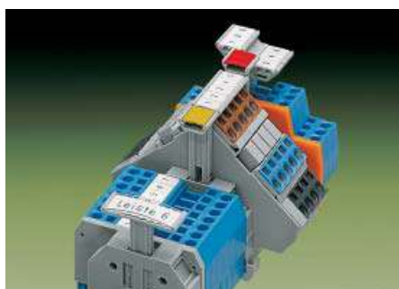
Гнезда для: 1 x маркерной карты 2 x WSB (Quick) или 3 x WCB (Combi) или 1 x WFB (полоска для непрерывной маркировки)