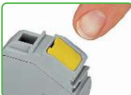
Вставка защиты от случайных прикосновений для неиспользуемых входов проводника.

Объединение клемм серии 285 (35 мм 2 /AWG 2) с клеммами серии 281 (4 мм 2 /AWG 12) с использованием ступенчатой перемычки 283-414. Ступенчатую перемычку просто нужно надавить вниз до полной вставки, подобно поперечным перемычкам. Примечание: Суммарный ток отводов не должен превышать номинальный ток ступенчатой перемычки.