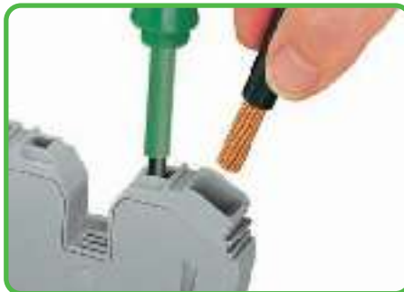
Заделка проводника 35 мм 2 /AWG 2.