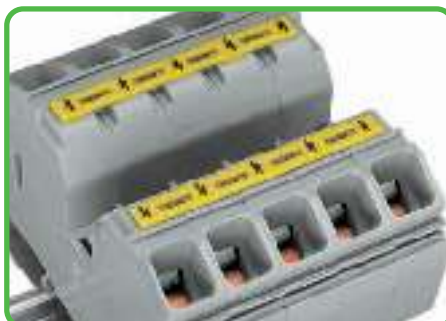
Предупреждающая маркировка, вставленная в отверстие для инструмента.