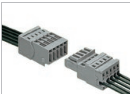
Вилка с зажимом CAGE CLAMP®. 1-проводная розетка, прямая.