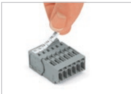
Вилка с зажимом CAGE CLAMP®. с системой быстрой маркировки mini-WSB